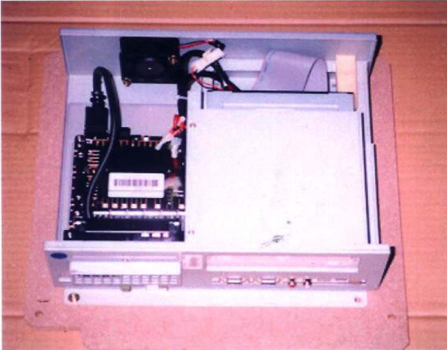
<기기 보드 및 서비스 버튼>